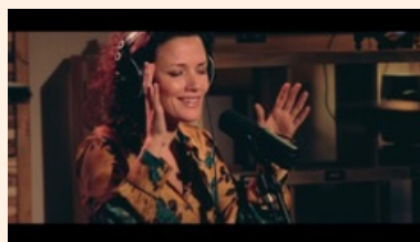
El día que me quieras