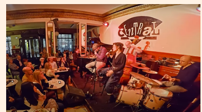
Por una cabeza (directo)